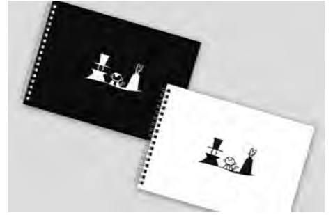
しろたえのおかオリジナルノート