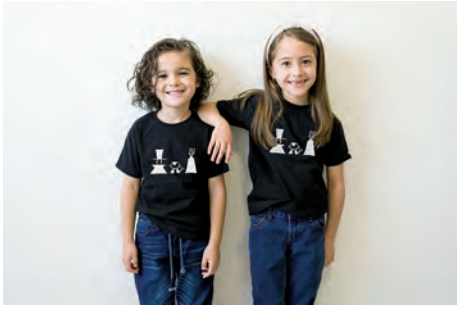
しろたえのおかTシャツ